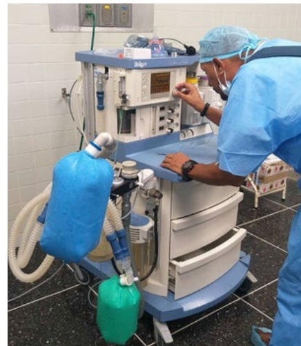
Sustitución del cable Holsing Drager, cedas del flujo y sensor de oxígeno.

Mora destacó que también se realizó el mantenimiento correctivo y preventivo de cinco lupas esteroscópicas del Laboratorio Fitosanitario del Instituto Nacional de Salud Agrícola Integral (Insai), ubicado en La Victoria, municipio Antonio Pinto Salinas del estado Mérida.