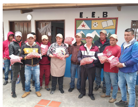
Agricultores de Gavidia recibieron más de seis mil semillas de papa nativa para su resguardo y producción.